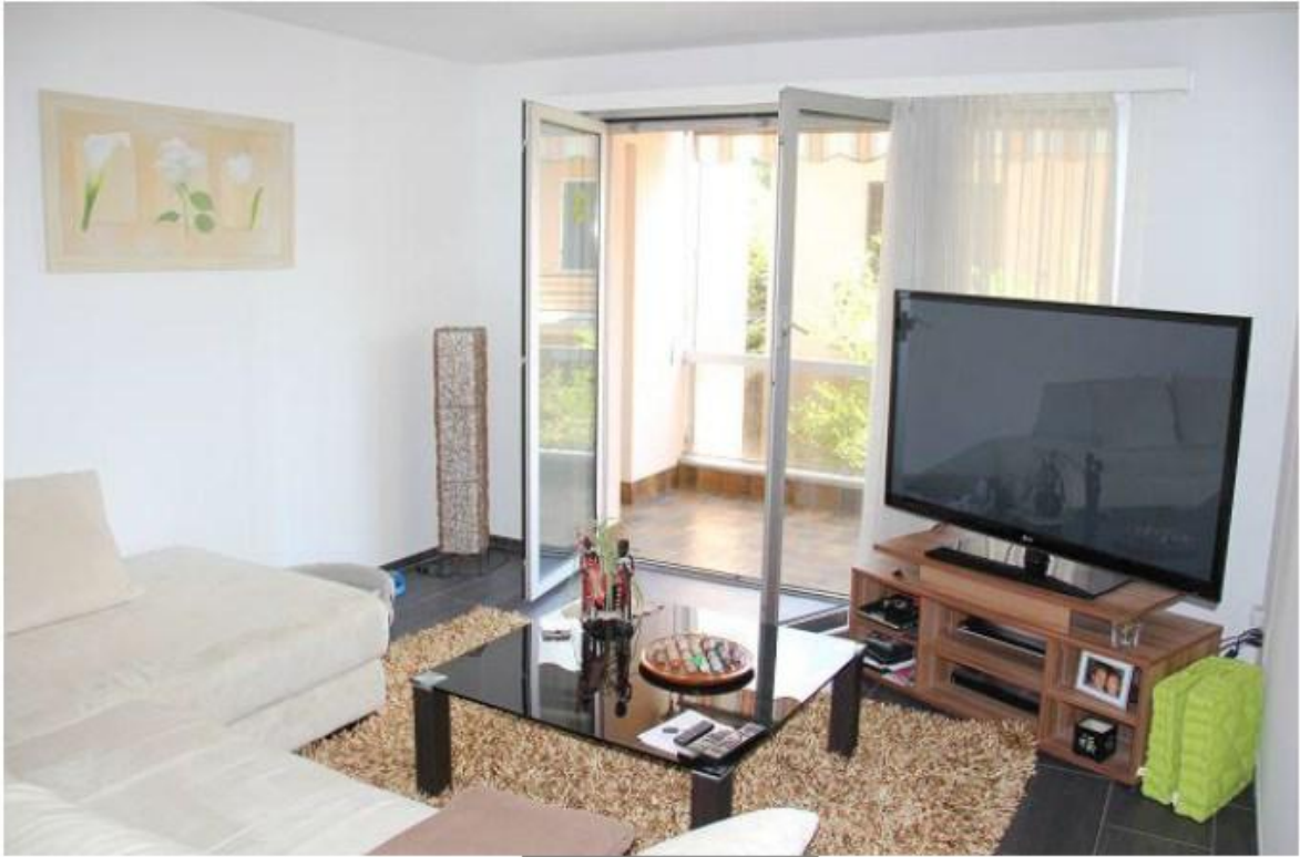
Wohnen und Essen ----- Soggiorno e pranzo