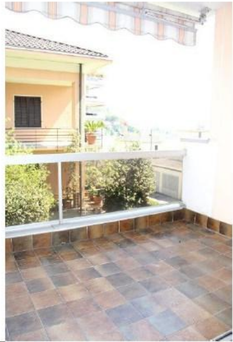
Wohnzimmer- balkon ..... balcone