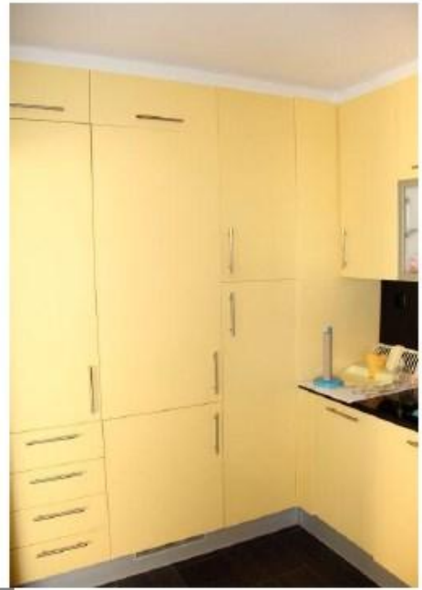
Küche mit Balkon ----- cucina con balcone