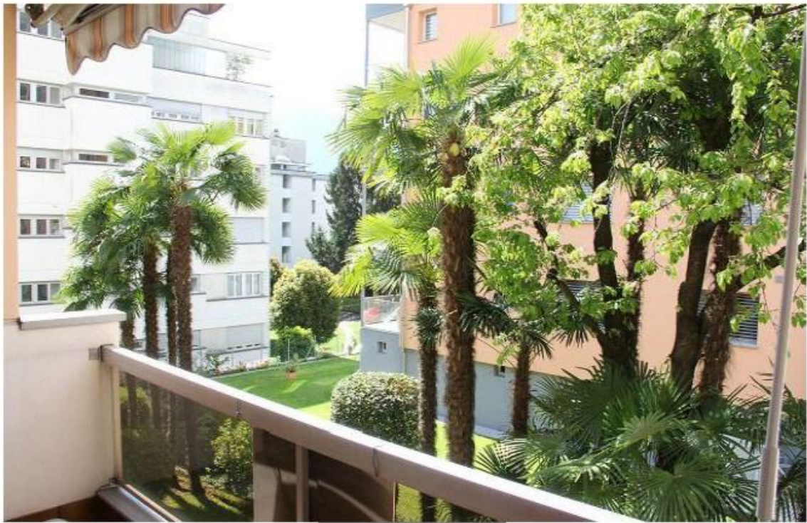
Umgebung ----- aree esterne