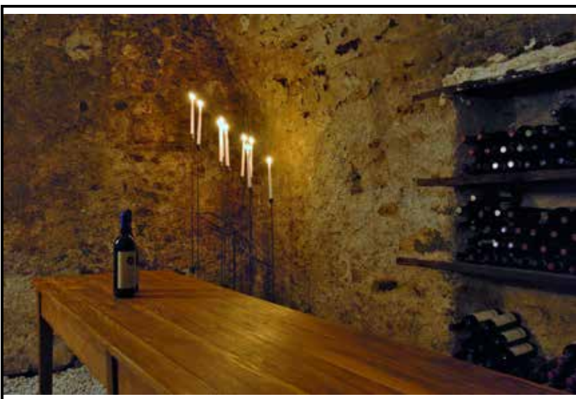
Weinkeller / Grotto