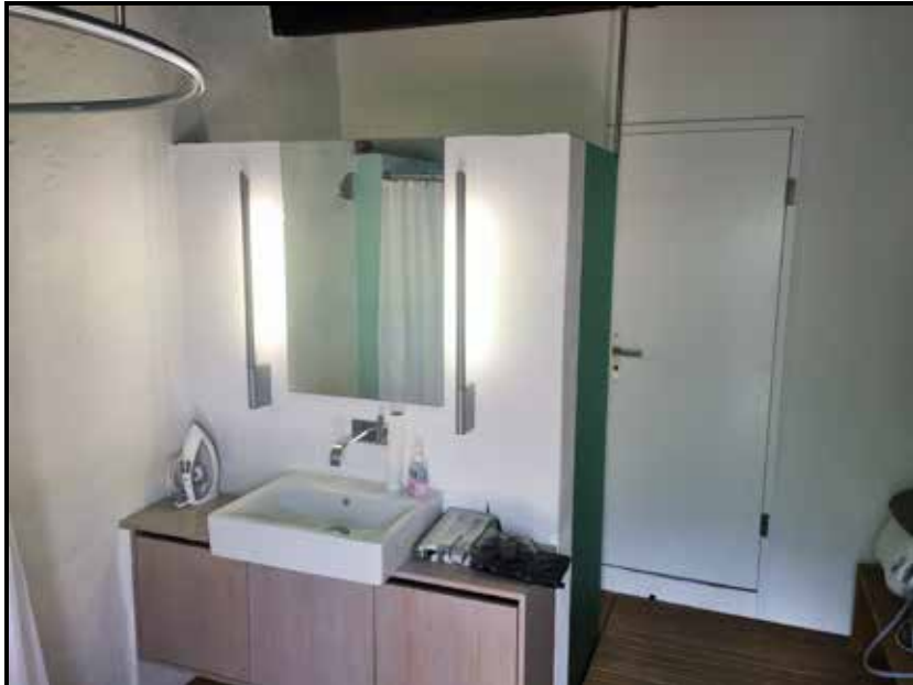
WC / Dusche 2