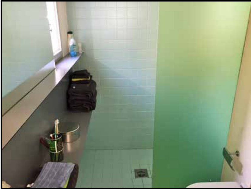
WC / Dusche