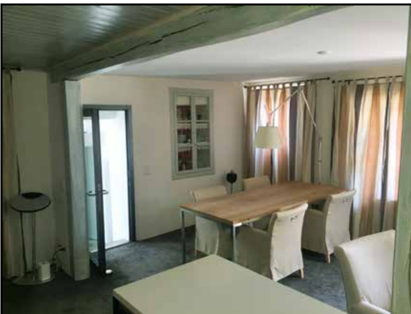
Wohn- & Essbereich