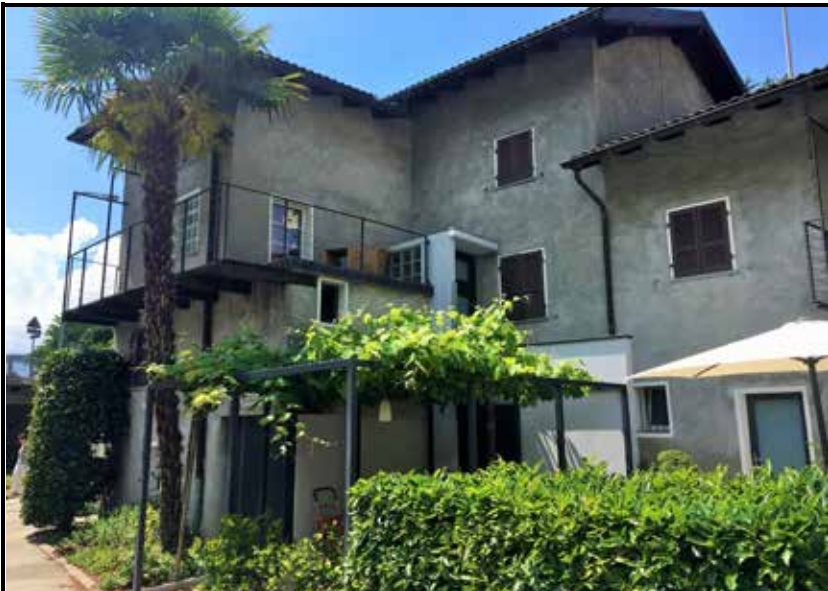
Hausansicht hinten & Pergola