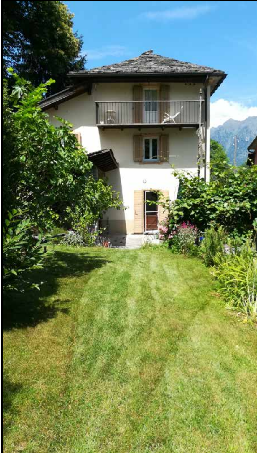
Hausansicht vom Rasen und der Garagen