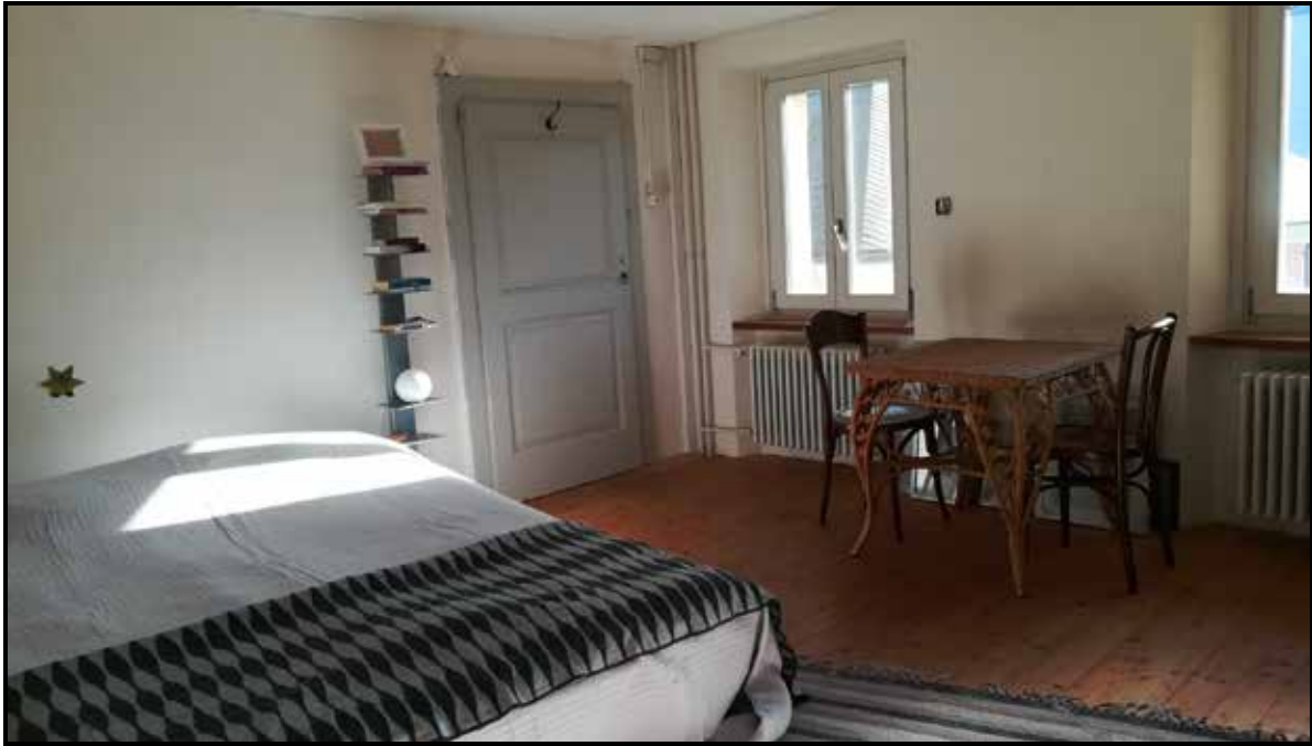
Schlafzimmer 2 mit Balkon