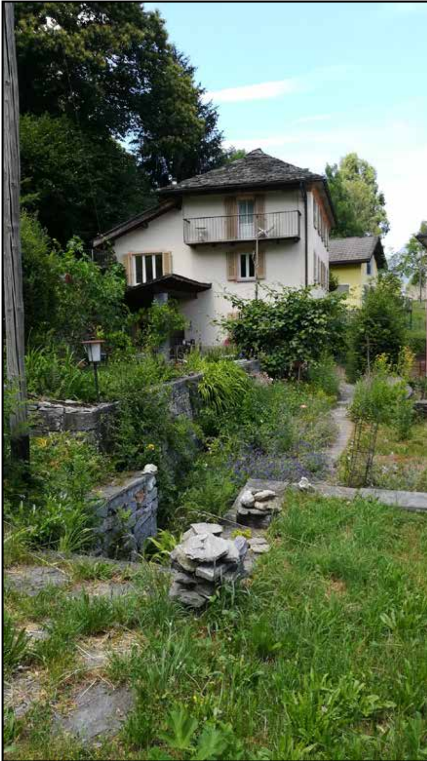
Hausansicht vom Blumengarten