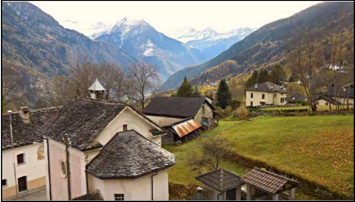
Aussicht ins Tal