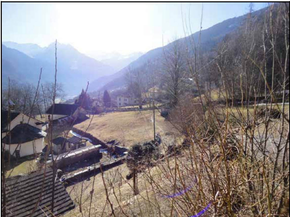
Aussicht aufs Grundstück und ins Tal