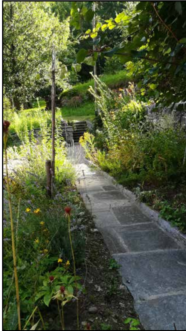
Kleiner Blumen- und Kräutergarten