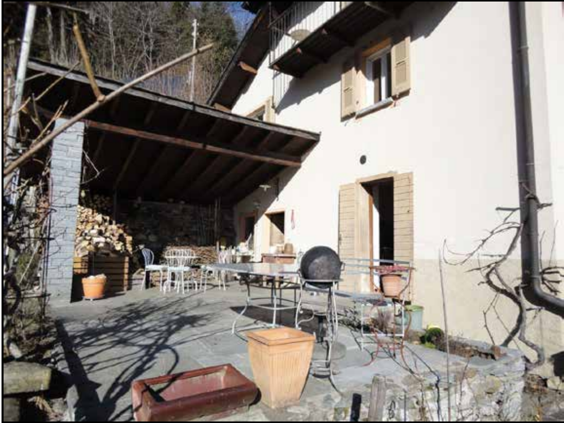
Pergola und Vorplatz bei Hauptwohnung