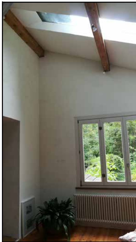
Wohnzimmer mit Dachfensterverglasung