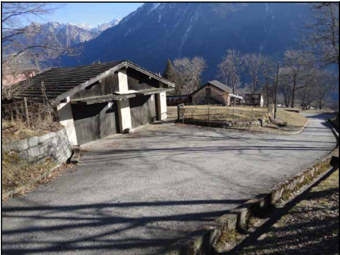
Garagenhaus mit 2 Autoeinstellplätzen